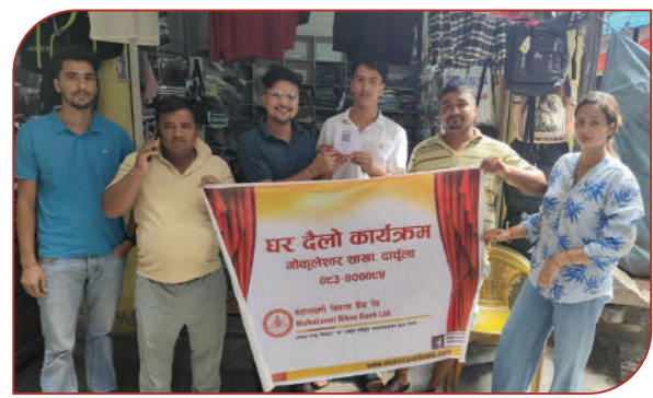
बैंकको शाखा कार्यालयहरू गोकुलेश्वर शाखा र मसुरिया शाखाले आयोजना गरेको घरदैलो कार्यक्रमका केही क्षलकहरू